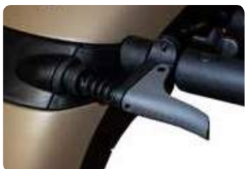
Levier de réglage du timon

Robuste et conçu pour durer, le Ranger saura séduire les utilisateurs les plus aventureux.