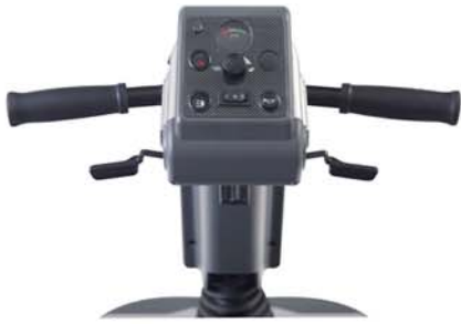
Guidon E3 - E4