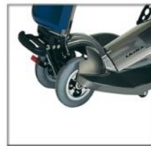
Grande maniabilité et stabilité