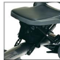
Rangement sous le siège